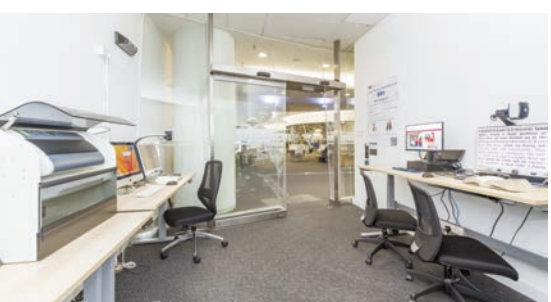
城大圖書館內專門設置的區域配備了適合有特殊需要學生使用的設備，包括螢幕閱讀器及適用於視障使用者的瀏覽器。

除支援服務組外，校內其他部門亦致力為SEN學生提供無障礙學習環境，以及加強他們使用校園資源設施的機會。以學生宿舍為例，校方會為行動不