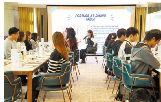
城大「Let Me Shine」系列近期舉辦了餐桌禮儀工作坊，旨在提升參加者於職場的社交技能，約有30名SEN學生參與。