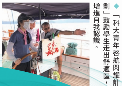
◆「科大青年啟航閃耀計劃」鼓勵學生走出舒適區，增進自我認識。