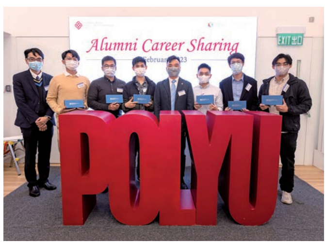
◆2023年2月舉行的「理大校友職業分享會」中，學生有機會與現職不同行業的校友交流。

而浸大則以「全人發展基金」籌辦主題為「全球氣候變化」的「國際虛擬黑客松（Hackathon）」，鼓勵學生與來自世界各地的大學生協作，就疫情下的新形態及各項全球性議題設計具創意及新穎的方案。張國威表示，項目將有效地讓來自世界各地的大學生在跨文化環境下合作，提出創新方案解決氣候問題，並藉此訓練學生設計思維，與他人協作及創意解難的能力。