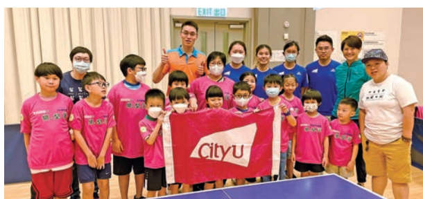
◆城大運動大使為灣仔青年大使會的5至11歲小朋友提供乒乓球訓練，一同享受乒乓球運動的樂趣。

城大則透過「運動大使計劃」培養學生對社群的關懷。城大學生發展處處長黃志添表示，此計劃自2017年開展，計劃成員包括各體育項目校隊隊長及具備教練及策劃活動經驗的隊員。校方期望運動大使通過參與策劃不同的服務獲得工作經驗，並體驗「非以役人，乃役人」的精神，達至全人發展。