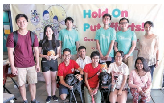
◆科大「Hold On, Put Efforts」計劃旨在幫助學生應對考試期間的壓力。