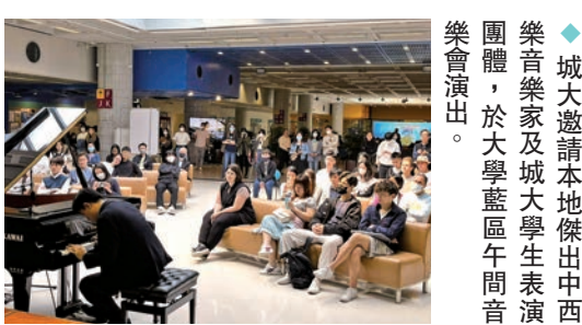
◆城大邀請本地傑出中西樂音樂家及城大學生表演團體，於大學藍區午間音樂會演出。