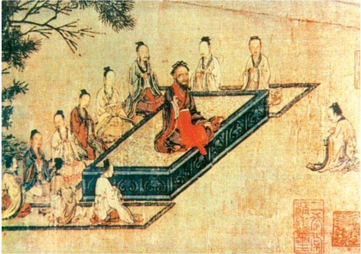
《孔子講學 (Confucian Lecture)》